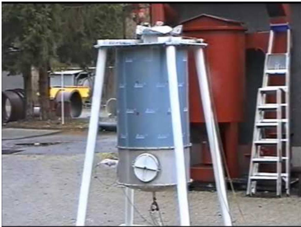
Explosion trials of a cartridge filter INFA-VARIO-JET type AJV to prove pressure shock resistance.