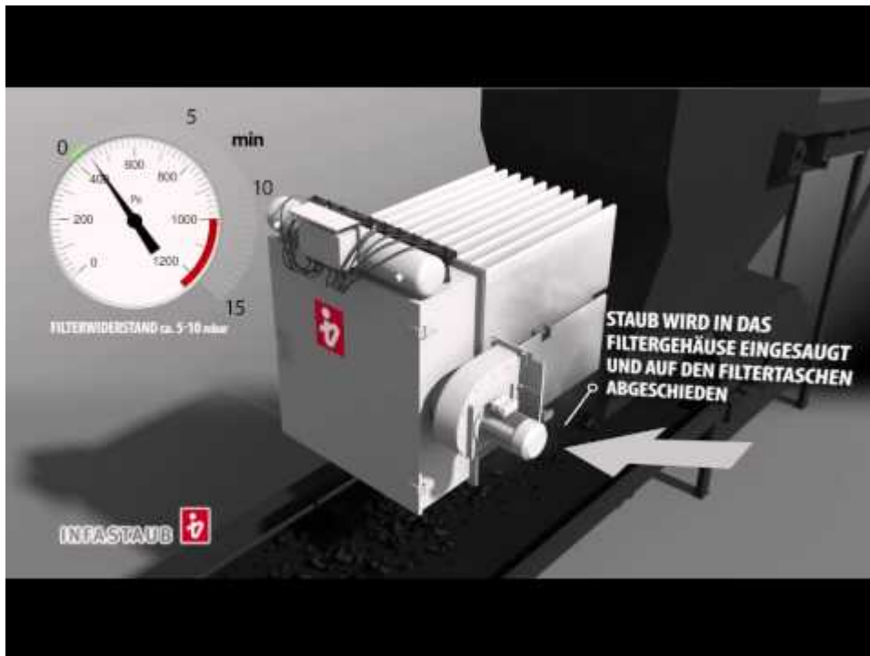
Förderbandentstaubung mit einem Aufsatzfilter in 3D Visualisierung von Infastaub.